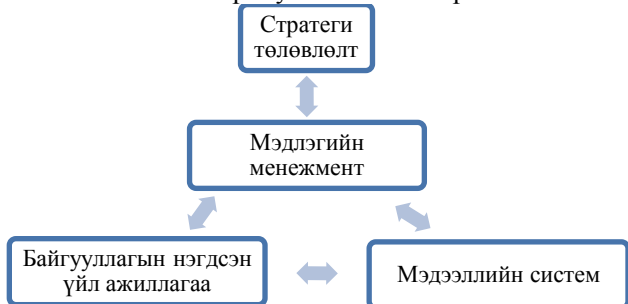
Зураг 2 Байгууллагын стратеги төлөвлөлт мэдээллийн системийн менежменттэй холбогдох нь

чадвар сайтай байж, бизнесийн ашиг, үр өгөөж өндөр байх нь тухайн байгууллагын урт хугацааны стратеги төлөвлөлт, түүний хэрэгжилтээс хамаарна. Байгууллагын стратеги бол байгууллага урт хугацаанд өмнөө тавьсан зорилгодоо хүрэхийн тулд авч хэрэгжүүлж байгаа үйл ажиллагаануудын ерөнхий хэв загварууд юм. Тухайн бизнесийн байгууллага салбарын дундаж ашгийн түвшнээс дээгүүр ашигтай ажиллаж байж өрсөлдөх чадвартай байдаг. Өрсөлдөөнд ялах үндсэн нөхцөл нь гол өрсөлдөгчөөсөө илүү ашгийн түвшинтэй ажиллах явдал юм. Тэгэхээр стратеги төлөвлөлтөд мэдлэгийн менежментийг зайлшгүй тусгаж өгөх нь зүйтэй юм.